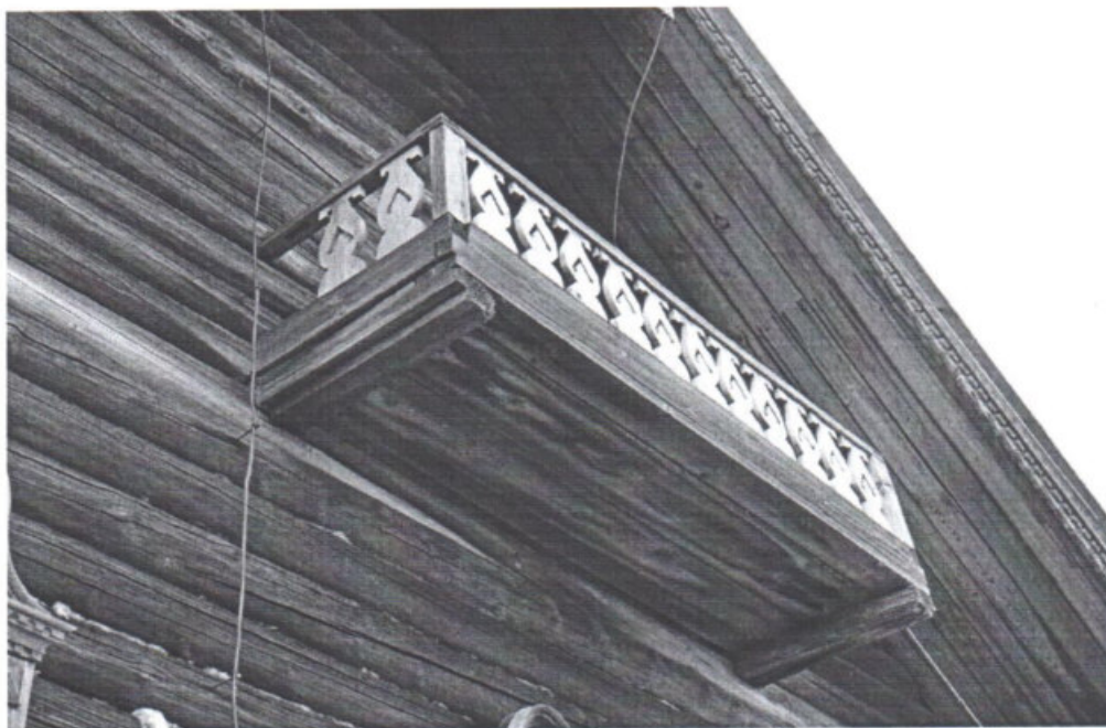
«Дом Пономарева (деревянный)», Республика Карелия, Медвежьегорский район, о. Кижы, д. Ямка Элемент декоративного убранства: балкон на консолях. Дата: 2016 г.