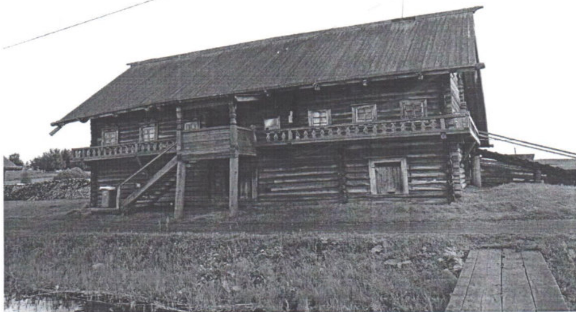
«Дом Пономарева (деревянный)», Республика Карелия, Медвежьегорский район, о. Кижы, д. Ямка Вид на главный (восточный) фасад. Дата: 2016 г.