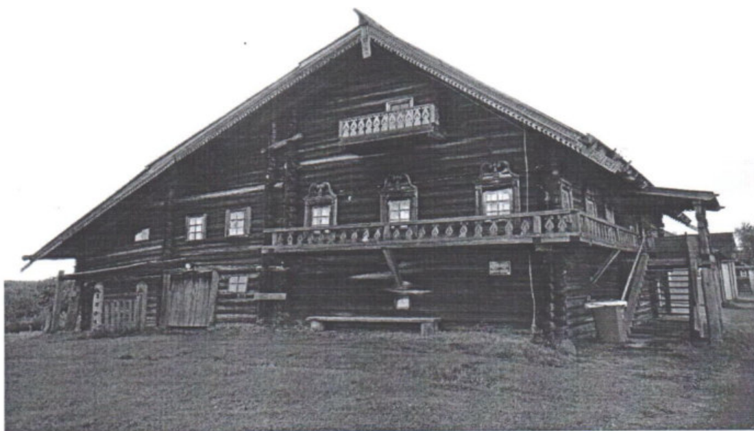
«Дом Пономарева (деревянный)», Республика Карелия, Медвежьегорский район, о. Кижы, д. Ямка Вид на южный фасад. Дата: 2016 г.