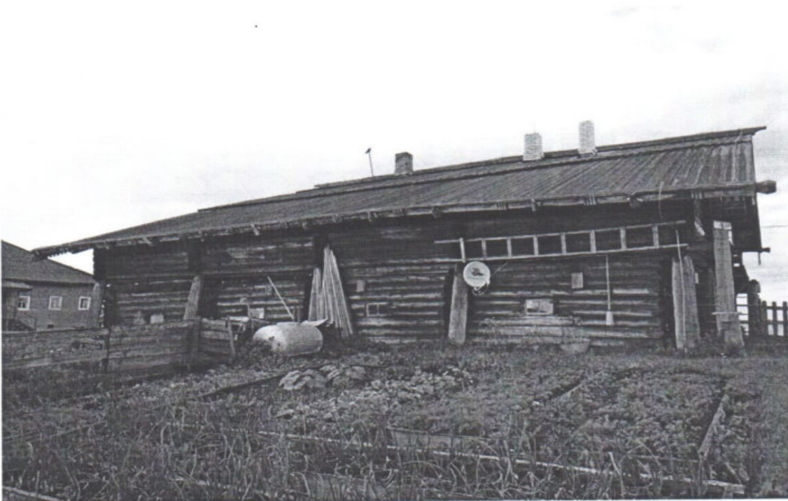
«Дом Пономарева (деревянный)», Республика Карелия, Медвежьегорский район, о. Кижы, д. Ямка Вид на западный фасад. Дата: 2016 г.