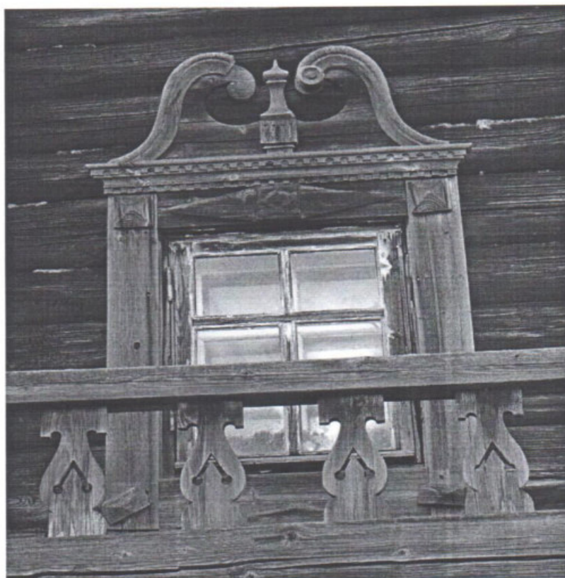
«Дом Пономарева (деревянный)», Республика Карелия, Медвежьегорский район, о. Кижы, д. Ямка Элементы декоративного убранства: резной наличник, дощатые балясины ограждения гультбища. Дата: 2016 г.