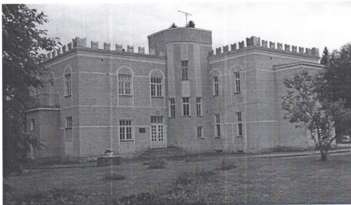
«Дом усадебный Таскинена» Республика Карелия, г. Лахденпохья, ул. Санаторная, д. 4а. Вид на главный фасад. Дата: 2015 г.