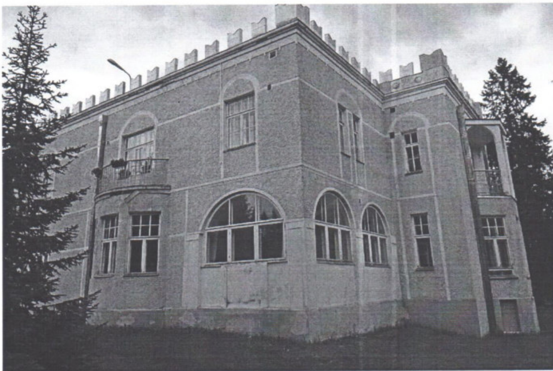
«Дом усадебный Таскинена»

Республика Карелия, г. Лахденпохья, ул. Санаторная, д. 4а.