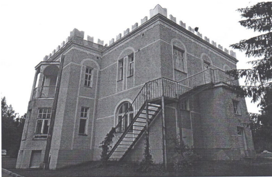
«Дом усадебный Таскинена» Республика Карелия, г. Лахденпохья, ул. Санаторная, д. 4а. Вид на дворовой и левый боковой фасады. Дата: 2015 г.