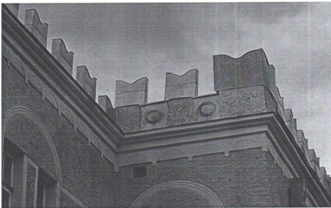
«Дом усадебный Таскинена»

Республика Карелия, г. Лахденпохья, ул. Санаторная, д. 4а.