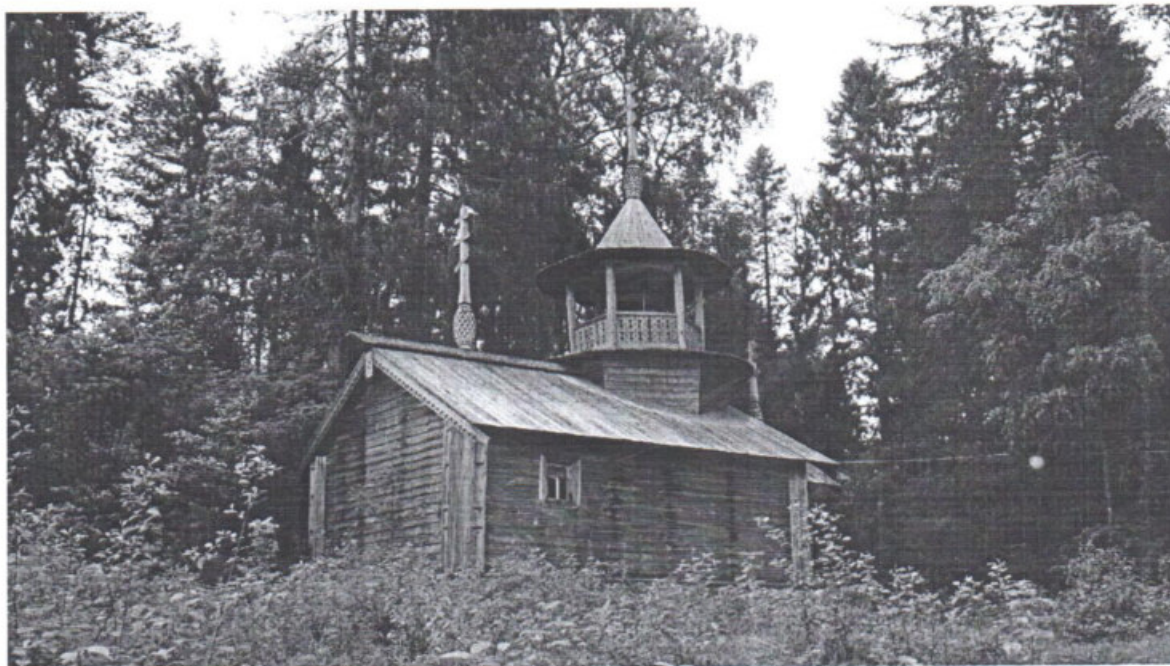
«Варваринская часовня (деревянная)» Республика Карелия, Пряжинский район, д. Коккойла Вид с северо-востока. Дата: 2016 г.