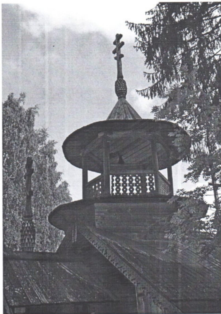
«Варваринская часовня (деревянная)» Республика Карелия, Пряжинский район, д. Коккойла Вид на звонницу. Дата: 2016 г.