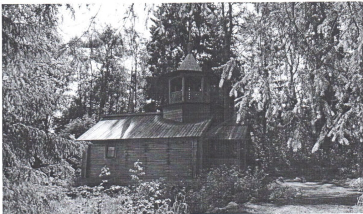
«Варваринская часовня (деревянная)» Республика Карелия, Пряжинский район, д. Коккойла Общий вид. Дата: 2016 г.