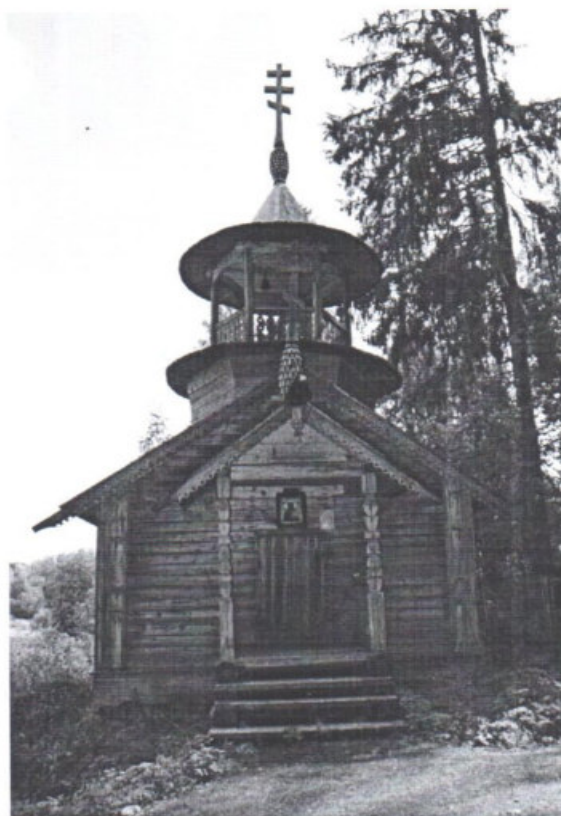
«Варваринская часовня (деревянная)» Республика Карелия, Пряжинский район, д. Коккойла Вид с запада. Дата: 2016 г.